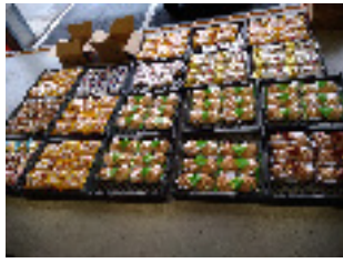
ご提供いただいたパン

パレットは、食料品を集めるフードドライブと集まった食料品を配布するフードパントリーに取り組んでいます。 2023年度は計6回のフードパントリーを行い、フードドライブ品694Kgを延べ83件245名へ配布することができました。